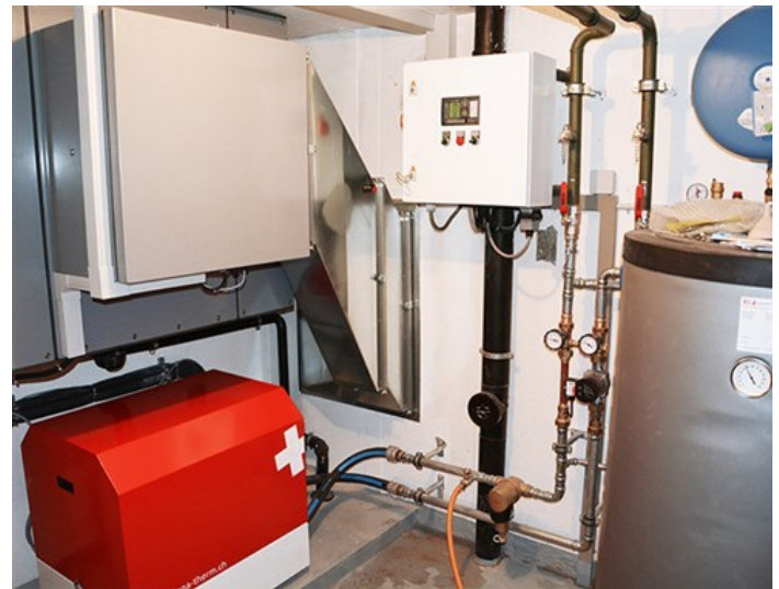
Innengerät AWS-I mit Pufferspeicher. (Hydraulik 2.0)