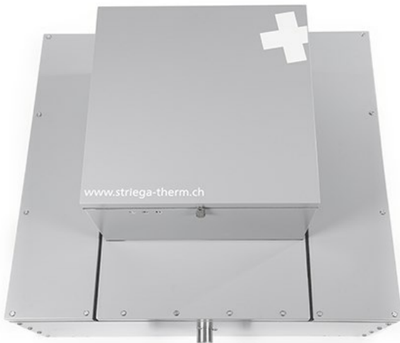
AWS-I Verdampfer, Ansicht von vorne. Ausblasseite wähl-/drehbar 90°/180°/270°/360°