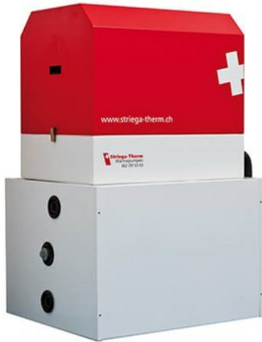
Innengerät AWS mit Unterstellspeicher 160 l. (Hydraulik 3.0/3.1)