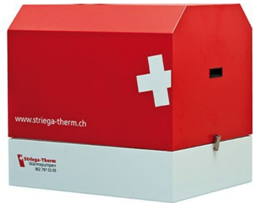
Innengerät AWS (Hydraulik 2.0/6.1/7.1/8.1)