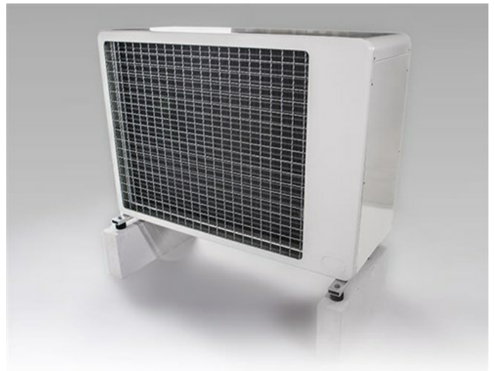
Geisshubel Verdampfer, Ansicht von hinten. (Ansaugseite)