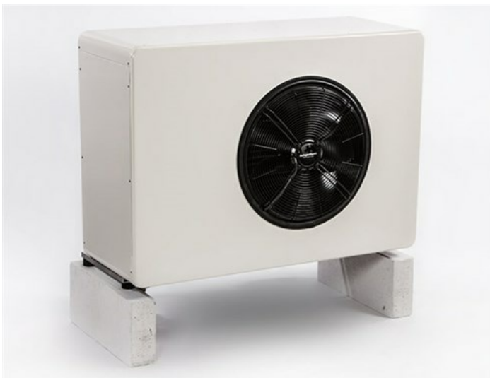
Geisshubel Verdampfer, Ansicht von vorne. (Ausblasseite)